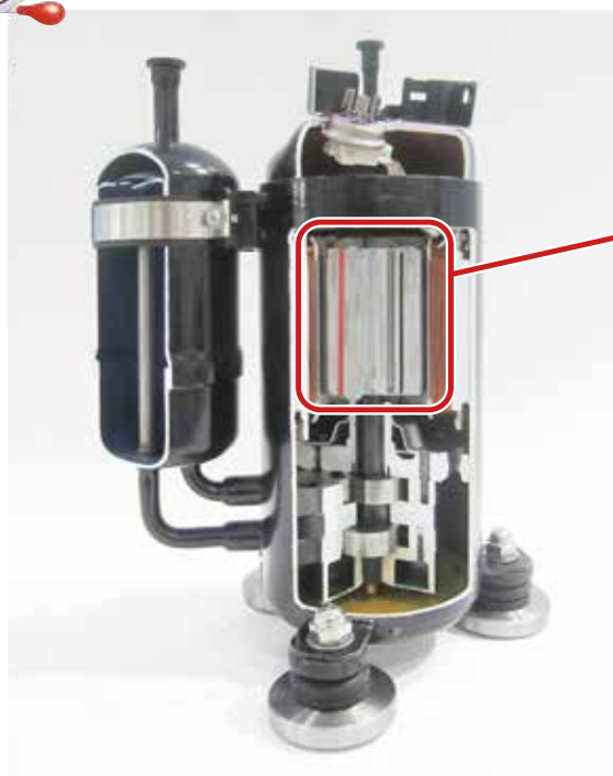
コンプレッサ カットモデル